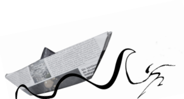
FOTO / VIDEO : Werken met de betekenis van het beeld en zijn constructie, sensibilisering voor de media en het decoderen van de boodschappen die ze verspreiden. Techniek en praktijk van reportages maken.

THEATER: Werken met emoties, improvisatie rond verschillende thema's, personages en situaties, en het verbergen van voorwerpen. Creatie van scènes.